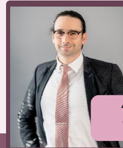
Ambasador rzetelności badawczej

Podkreśla, znaczenie odpowiedzialnego prowadzenia badań dla społeczeństwa